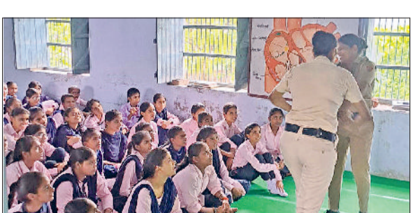
भट्टकलां। छात्राओं को आत्मरक्षा के गुर सिखाती महिला पुलिस कर्मचारी।

बचाव, और खतरे की स्थिति में त्वरित प्रतिक्रिया देने के तरीकों का अभ्यास करवाया। कार्यक्रम में छात्राओं ने उत्साहपूर्वक भाग लिया और सिखाई गई तकनीकों का प्रदर्शन भी किया। प्रशिक्षकों ने उन्हें यह भी समझाया कि साहस, सतर्कता और आत्मविश्वास के साथ कैसे किसी भी विपरीत परिस्थिति का सामना किया जा सकता है। विद्यालय की प्रधानाचार्या ने इस पहल की सराहना करते हुए कहा, इस प्रकार का प्रशिक्षण न केवल छात्राओं को आत्मरक्षा के लिए सक्षम बनाता है, बल्कि उनके भीतर आत्मविश्वास और जागरूकता की भावना भी विकसित करता है। हम पुलिस के प्रति आभार व्यक्त करते हैं।