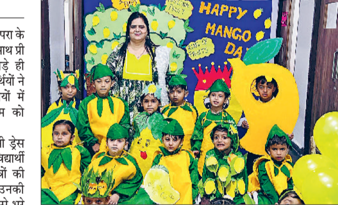
प्री प्राइमरी विंग में मनाया मैंगो डे

कार्यक्रम की शुरुआत रंगारंग फैसली ड्रेस प्रतियोगिता से हुई, जिसमें नर्तक-नर्तकी विद्यार्थी आम एवं आम से जुड़े विभिन्न पात्रों की वेशभूषा में मंच पर प्रस्तुत हुए। उनकी रचनात्मक पोशाकों एवं आत्मविश्वास से भरे प्रदर्शन ने सभी उपस्थितजन का मन मोह लिया। विद्यार्थियों द्वारा लाए गए आम से बने पारंपरिक एवं नवीन व्यंजनों की एक प्रदर्शनी