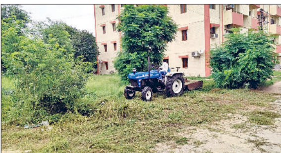
फतेहाबाद। पुलिस कालोनी में एसपी के निर्देशों के चलता सफाई अभियान।