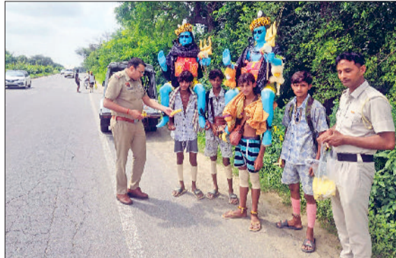
फतेहाबाद। कांवड़ियों को फल वितरित करते पुलिस कर्मचारी।

मंदिर, लक्ष्मीनारायण मंदिर, शनि मंदिर सहित सभी मंदिरों में मंगलवार को भी श्रद्धालुओं का तांता लगा रहा।