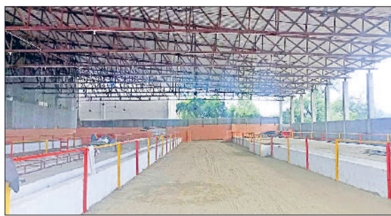
टोहाना। शिव नंदीशाला में बनाया गया 'पशु आवास'।