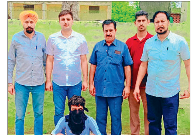
फतेहाबाद। हरिद्वार से पकड़ा गया चोरी का आरोपी।