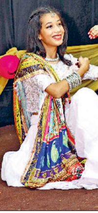
अपेक्स स्कूल में आयोजित टेलेंट हंट में प्रस्तुति देती छात्राएं।