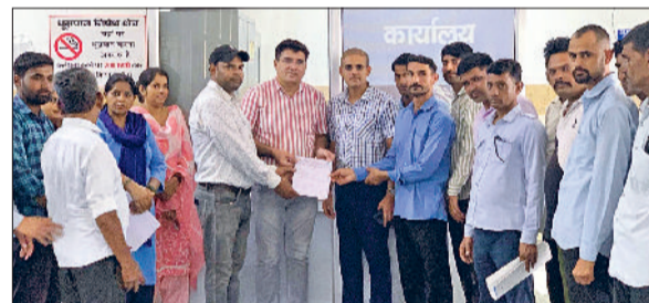
फतेहाबाद। अधिकारी को सीएम के नाम ज्ञापन सौंपते अनुबंध स्वास्थ्य कर्मचारी संघ के पदाधिकारी।

हरियाणा में स्वास्थ्य विभाग के अंतर्गत कार्यरत एचकेआरएन अनुबंधित कर्मचारियों की समस्याओं को लेकर अनुबंध स्वास्थ्य कर्मचारियों संघ ने एक बार फिर सरकार के समक्ष अपनी मांगें मजबूती से रखते हुए आंदोलन की चेतावनी दी है। संघ ने साफ कर दिया है कि यदि समस्याओं का शीघ्र समाधान नहीं किया गया तो वह 4 अगस्त को प्रदेश स्तरीय बैठक कर आगामी आंदोलन की रणनीति तय करेगा। इसको लेकर सीएम को भी ज्ञापन भेजा गया है। संघ की ओर से मुख्यमंत्री को भेजे