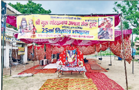
फतेहाबाद। हिसार रोड पर सैक्टर 3 के पास शिवभक्तों के लिए लगा भंडारा।

महाशिवरात्रि पर्व को लेकर फतेहाबाद में आज महाउत्सव-सा नजारा नजर आ रहा है। फतेहाबाद के सभी मंदिरों में जगमगाती लाइटिंग की व्यवस्था की गई है। शहर का ऐसा कोई मार्ग नहीं है, जहां शिवभक्तों के लिए भंडारे न लगे हों। मंदिरों के बाहर शिव शंकर की धुन बजने के साथ ही बाहर स्थलों सज गई हैं। आज महाशिवरात्रि के पर्व पर अलसुबह 4 बजे से पूर्व ही मंदिरों में घंटाल बजने शुरू हो जाएंगे। एक अनुमान के अनुसार फतेहाबाद शहर में करीब 112 जगह शिवभक्तों के लिए भंडारे लगे हुए हैं। इन भंडारों में मेडिकल सुविधा से लेकर एक से एक बर्दिया फ्रूट, व्यंजन और रहने तथा नहाने-धोने की व्यवस्था की गई है। हरिद्वार से गंगाजल लेकर आ रहे कांवड़ियों का जत्था पवित्र गंगाजल लेकर वापस आने लगा है। शहर में जगह-जगह पर शिविर लगाकर लोग कांवड़ियों की सेवा कर रहे हैं। कांवड़ियों अपने साथ 100 लीटर जल तक लेकर आ रहे हैं। इस आस्था को देखकर शिविरों में सेवक भी अभिभूत हैं। नेशनल हाईवे स्थित दुर्गा मंदिर को मध्य लाइटों से सजाया गया है। शिवरात्रि की पूर्व संंध्या पर मंदिर में रंग खिरंगी लाइट लगाने का कार्य शुरू हो गया था। मंदिर में प्रवेश और निकास की व्यवस्था अलग-अलग की जा रही है, ताकि महिलाओं, बच्चों को कोई असुविधा नहीं हो।