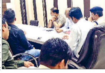
सीईटी परीक्षा शांतिपूर्ण व पारदर्शी तरीके से संचालित करवाएं अधिकारी: उपायुक्त

सिरसा। उपायुक्त शांतनु शर्मा ने 26 और 27 जुलाई को आयोजित होने वाले कॉमन एलिजिबिलिटी टेस्ट (सीईटी) परीक्षा 2025 की तैयारियों को लेकर जिला के वरिष्ठ अधिकारियों के साथ बैठक की और आवश्यक दिशा-निर्देश जारी किए। बैठक के दौरान उन्होंने परिवहन, सुरक्षा, परीक्षा केंद्रों में मूलभूत सुविधाओं व अन्य व्यवस्थाओं की समीक्षा की और अधिकारियों को समग्रबद्धता के साथ कार्य पूर्ण करते हुए परीक्षा शांतिपूर्ण व पारदर्शी तरीके से संचालित करने के निर्देश दिए। उपायुक्त ने कहा कि परीक्षा के दौरान परीक्षार्थियों को किसी भी प्रकार की असुविधा न हो, इसके लिए सभी संबंधित विभाग समन्वय बनाकर कार्य करें। वहीं पुलिस अधीक्षक डा. मयंक गुप्ता ने कहा कि सीईटी परीक्षा के लिए जिला में व्यापक सुरक्षा प्रबंध किए गए हैं। कानून एवं शांति व्यवस्था बनाए रखने व परीक्षा के सुचारु संचालन के लिए पर्याप्त संख्या में पुलिस बल की तैनाती रहेगी। इससे पहले हरियाणा के मुख्यमंत्री श्री नारायण सिंह सेना ने सीईटी परीक्षा को लेकर वीडियो कांफ्रेंसिंग के माध्यम से प्रदेश भर की तैयारियों की समीक्षा की। उन्होंने सभी जिलों के अधिकारियों को परीक्षा के सफल आयोजन हेतु पुष्ता प्रबंध करने के निर्देश दिए।